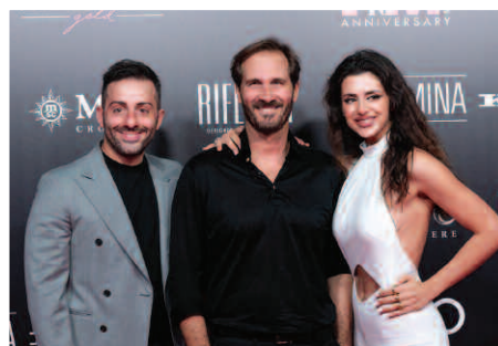
i'M LUGLIO-AGOSTO 2024